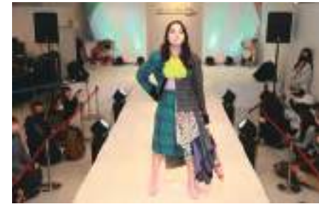
当日のイベントの様子