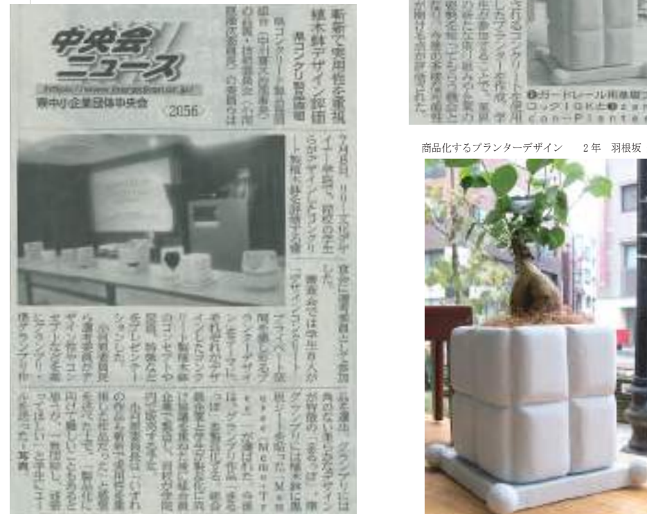
商品化するプランターデザイン 2年 羽根坂 知佳