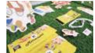
常陸大宮市プレゼンテーションの様子