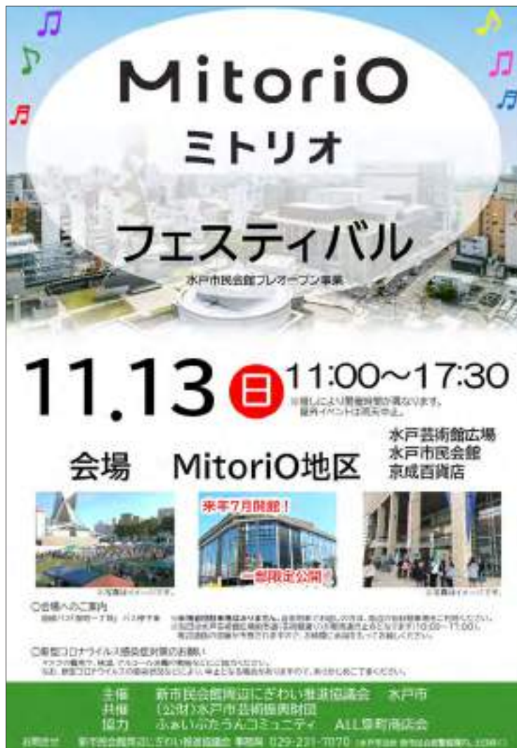
当日のイベントの様子

11月13日(日)に行われた、新水戸市民会館の竣工を祝う水戸市主催イベント「MitoriOフェスティバル」に地下店舗「glows」のポップアップショップをOPENしました。当日はファッションビジネス学科2年生が設営から接客まで行い、多くのお客様が来店されました。